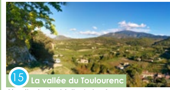
15 La vallée du Toulourenc

Circuit principal (aller/retour) 51 km 31 miles / D+ 900 Départ : Entrechaux ENTRECHAUX > SAINT-LÉGER-DU-VENTOUX > BRANTES > SAVOILLANS