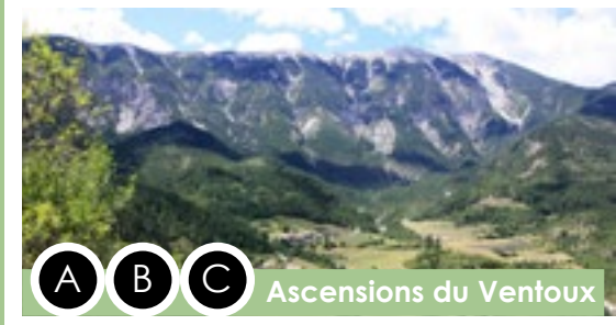
A B C Ascensions du Ventoux

Option par le col de Fontaube (Drôme) 59 km 37 miles / D+ 880 Départ : Entrechaux - Parking à la sortie du village route de Mollans ENTRECHAUX > SAINT-LÉGER-DU-VENTOUX > BRANTES > SAVOILLANS > EYGALIERS > PIERRELONGUE > MOLLANS-SUR-OUVEZE